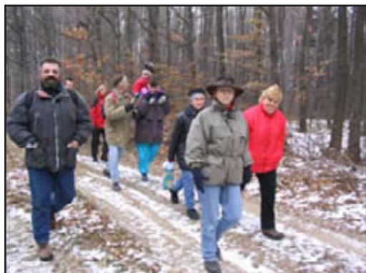
Pochod na Brdo