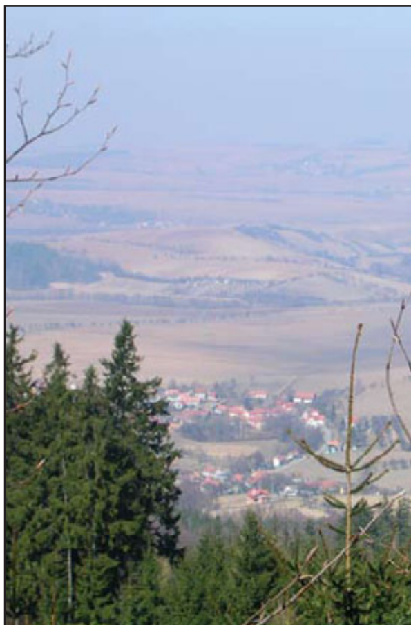
Výhled z Brda