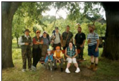
Výlet na Buchlov