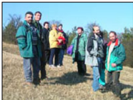
Ochranáři na Přehoně