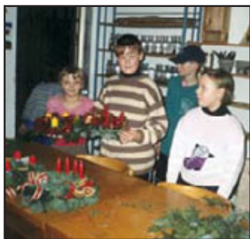
Výroba adventních věnců