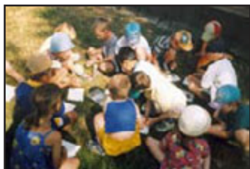
Svět Ferdy Mravence, MŠ Zborovice