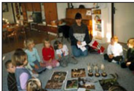
Lov pro ZOO - Evropa, MŠ Morkovice