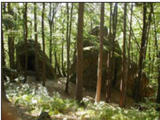
Výlet na Budačín