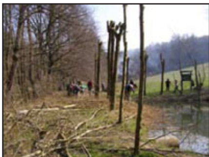
o ez a úklid vrb u rybníka