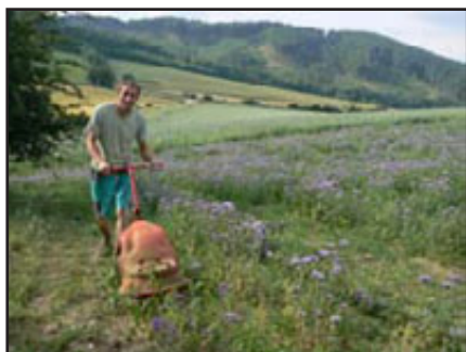
sečení nové plochy - svazenka

Obdobná situace v menším rozsahu proběhla na PP Drážov. Podle instrukcí a požadavků Zlínského kraje byl smýcen veškerý divoký náletový porost ze svahu v horní – SV části chráněného území. Původně neprostupný svah porostlý divokými hustými a trnitými křovinami se namáhavou prací za pomoci motorových pil a křovinořezů a lidské práce odkrýval a měnil svou tvář. Dalo to ještě moc práce, řezání, pálení a vyhrabování, osetí osivem a zase několikrát sečení křovinořezy a úklid posečené biomasy, než se svah změnil do dnešní podoby.