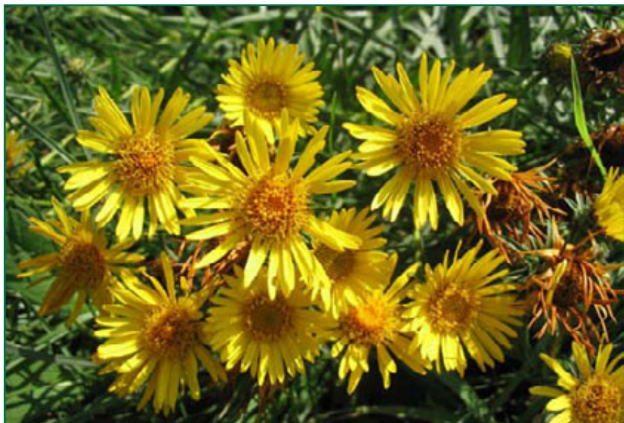
Oman vrbolistý (Zákostelí)