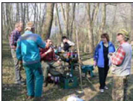
brigáda p ed Otvíráním studánek, 31. b ezna 2007