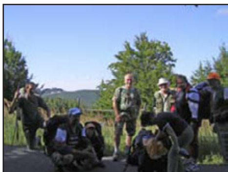
letní pochod přes Chyby