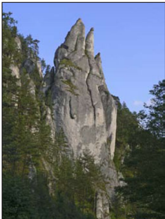
výlet do Sú ovských skal