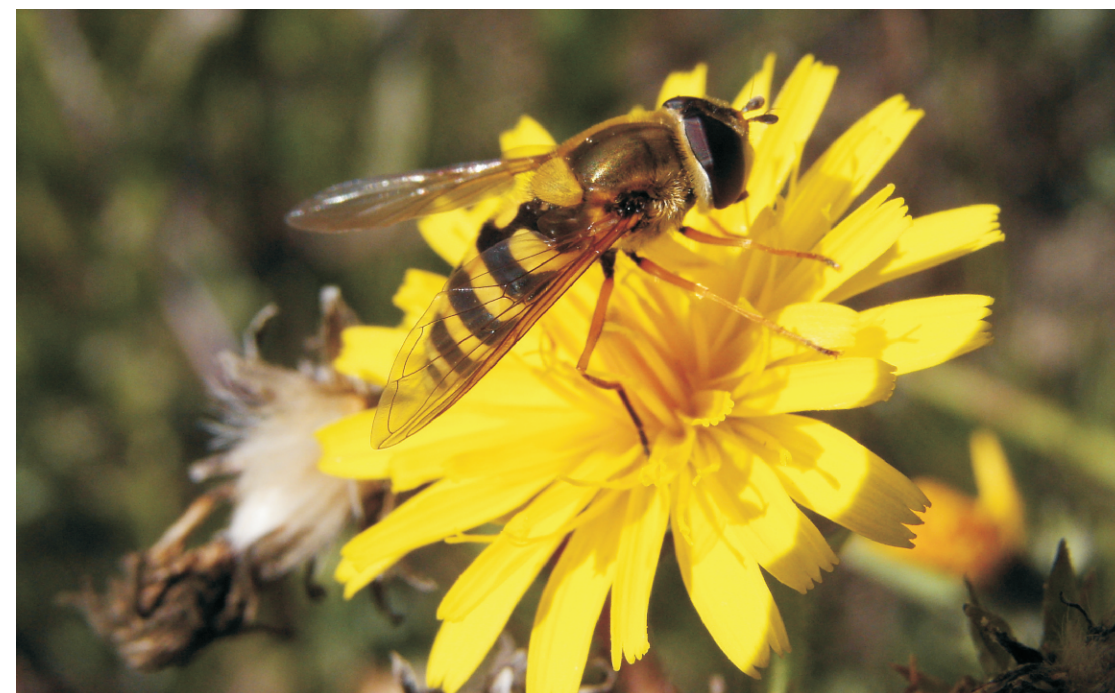
Pestřenka rybízová PP Včelín