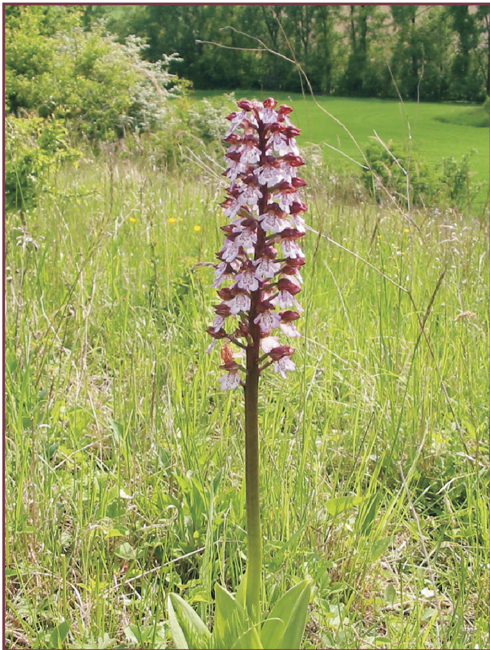
Vstavač nachový lokalita Skalka Trňák