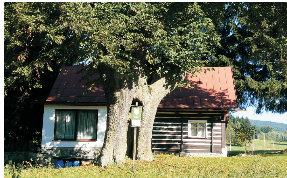
LÍPA V POLOMU Orlické hory