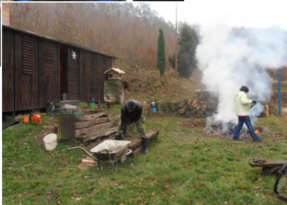
Brigáda u vagónu