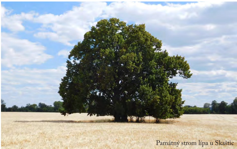
Památný strom lípa u Skaštic