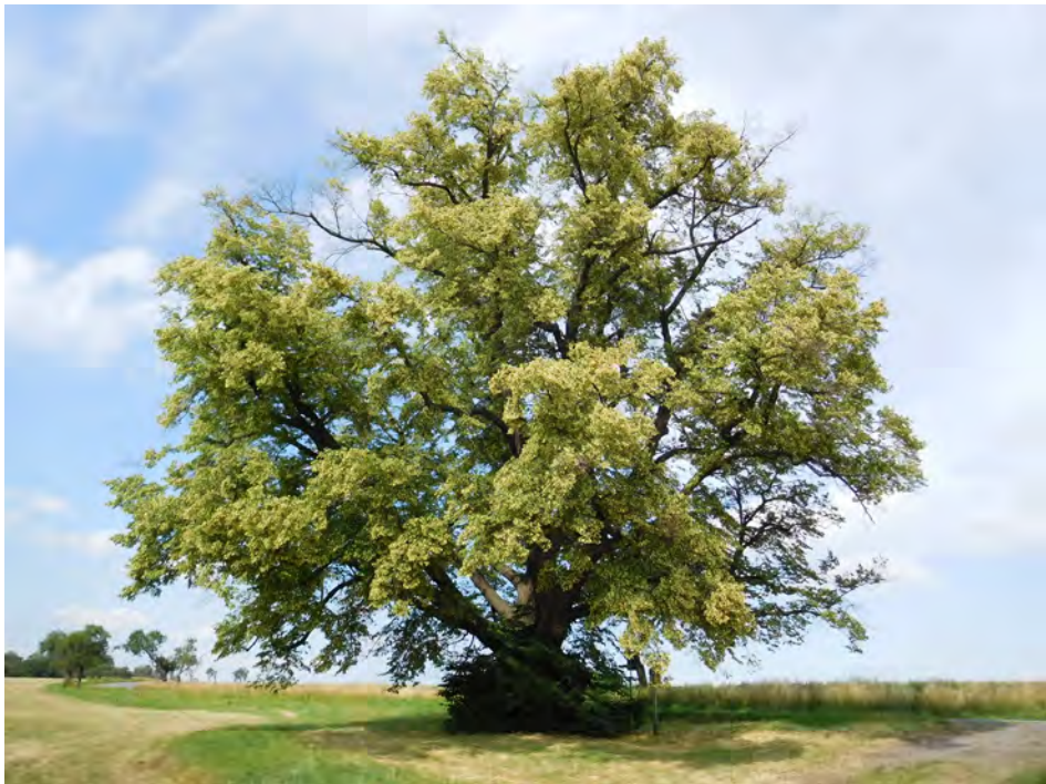
Památný strom Těšanská lípa