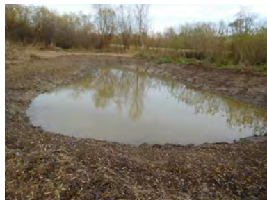
Budování nové mokřadní tůňky u Troubek