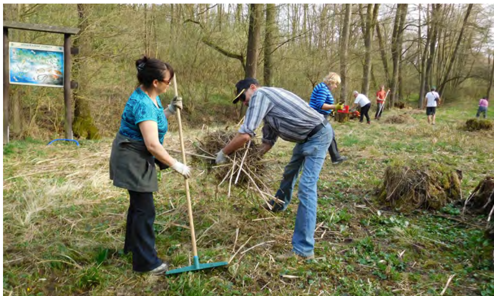
Brigáda před studánkami