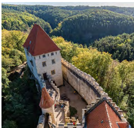
Výlet za poznáním Kokořínsko