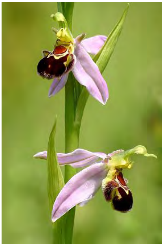
Zdounky Zákostelí - Tořič včelonosný (Ophrys apifera)