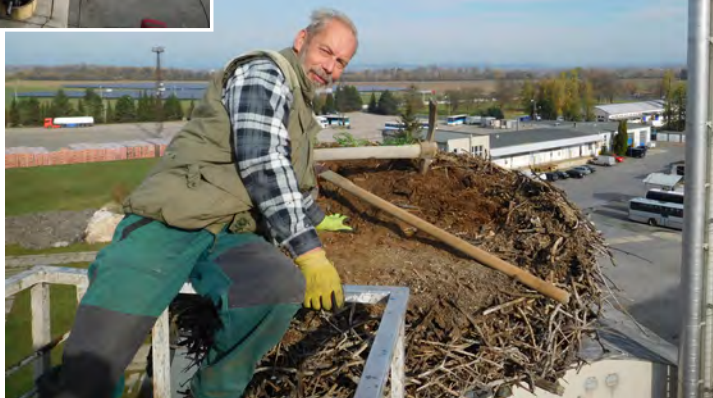
Oprava hnízdní podložky pro čápy