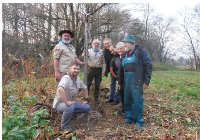
Výsadba lípy k výročí 100 let republiky