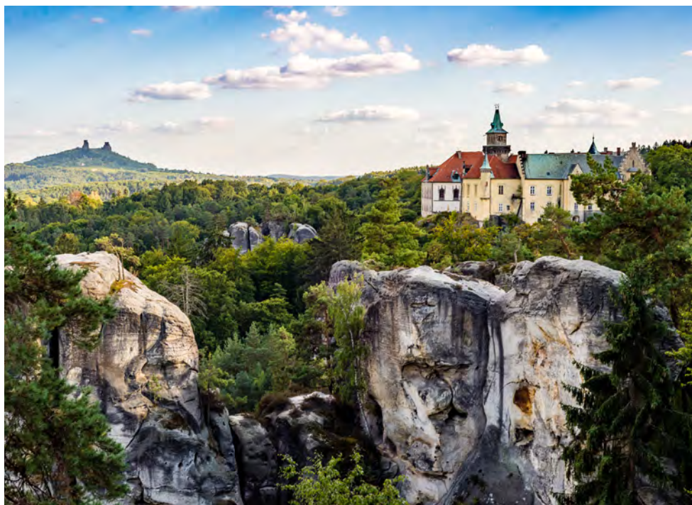
Celostátní setkání členů ČSOP v Sedmihorkách