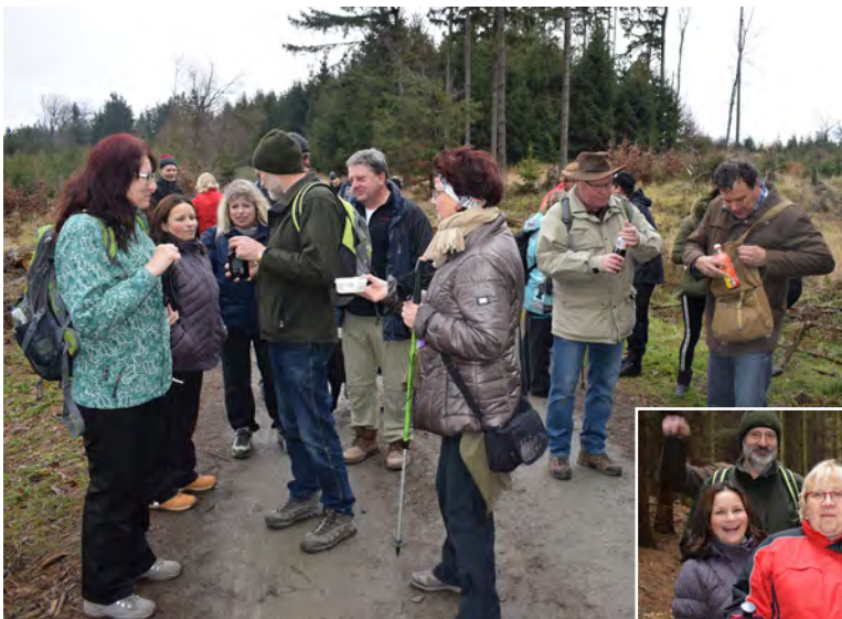
Výšlap na Brdo