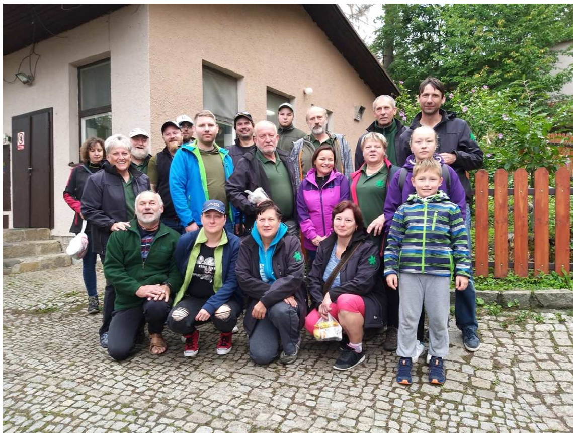
Celostátní setkání ČSOP Vanov