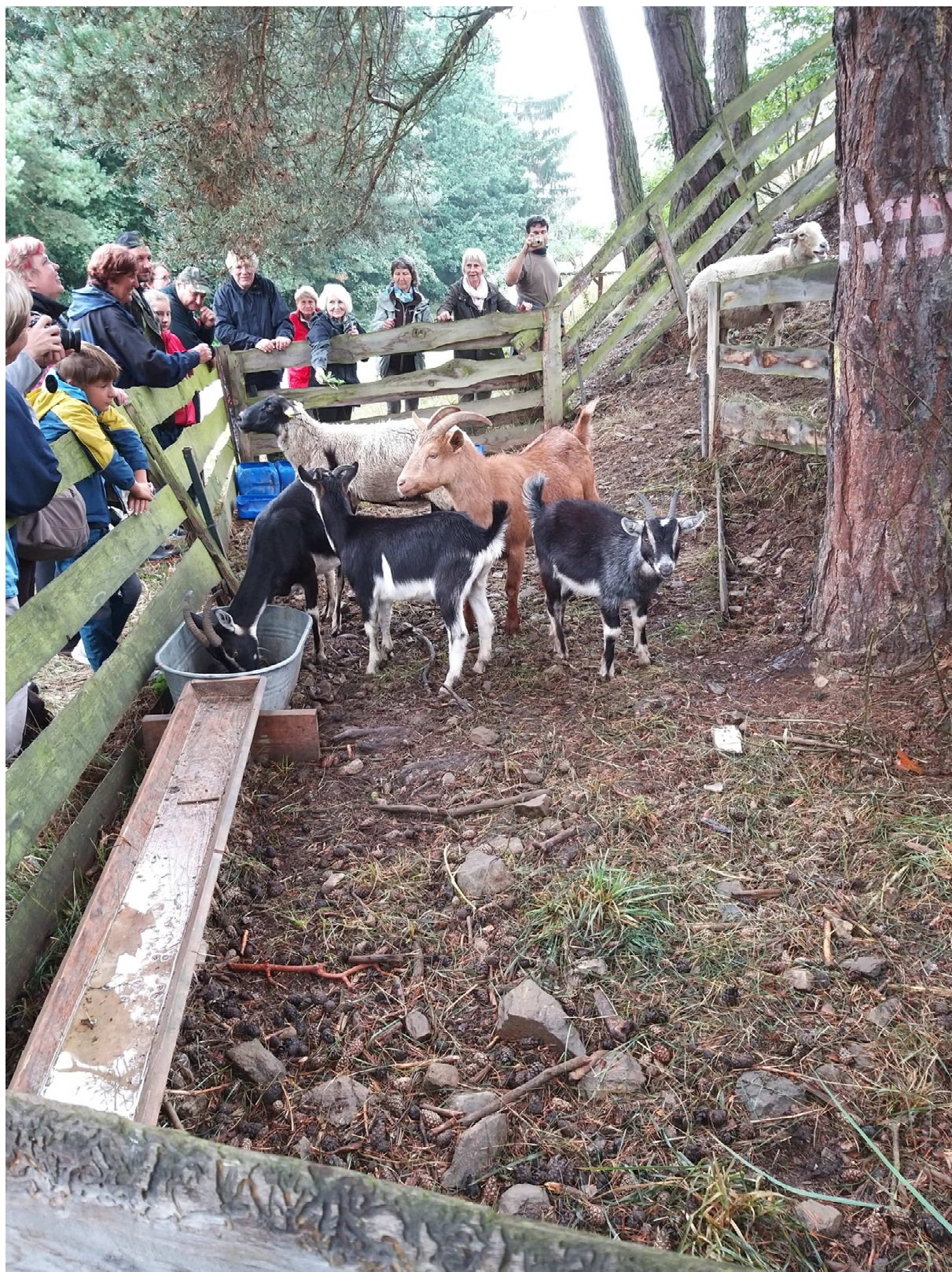
Celostátí setkání ČSOP Vanov