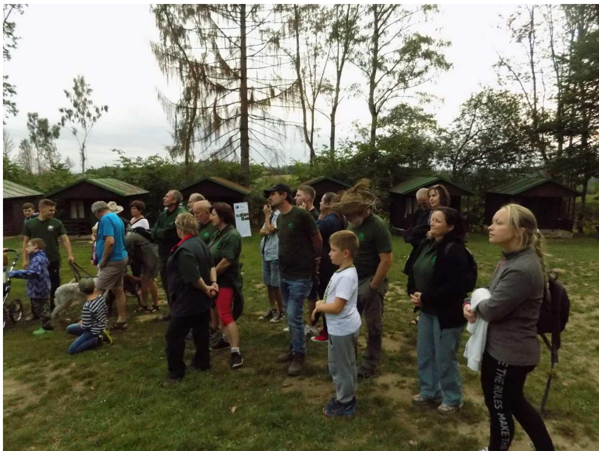
Celostátní setkání ČSOP Vanov