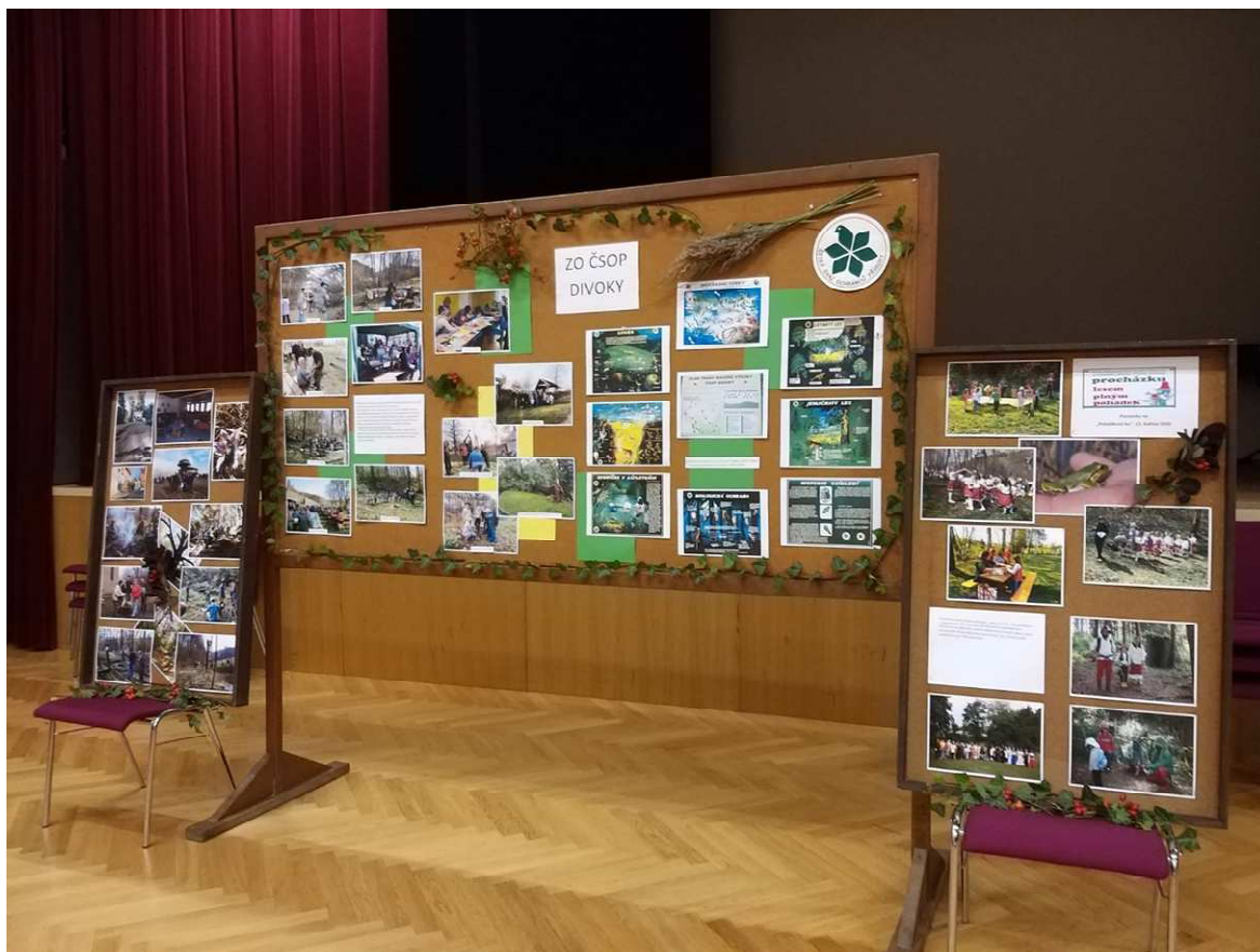
Prezentace na výstavě ve Zdounkách