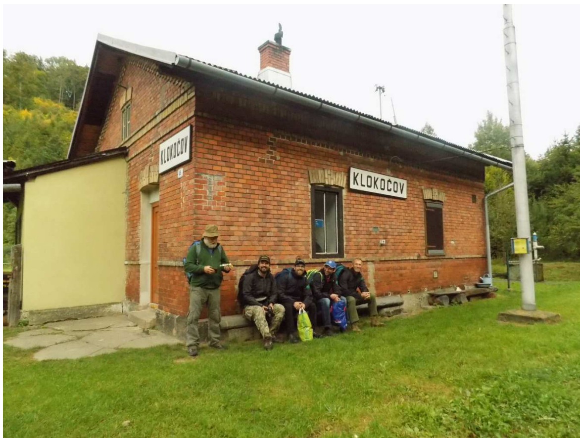
Návštěva u ČSOP Odry