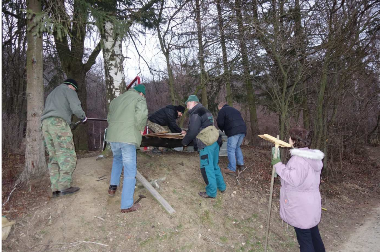
Brigáda únor 2019