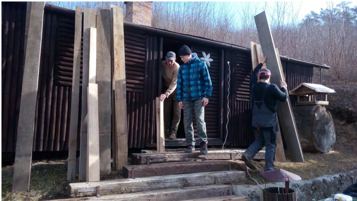
Brigáda únor 2019