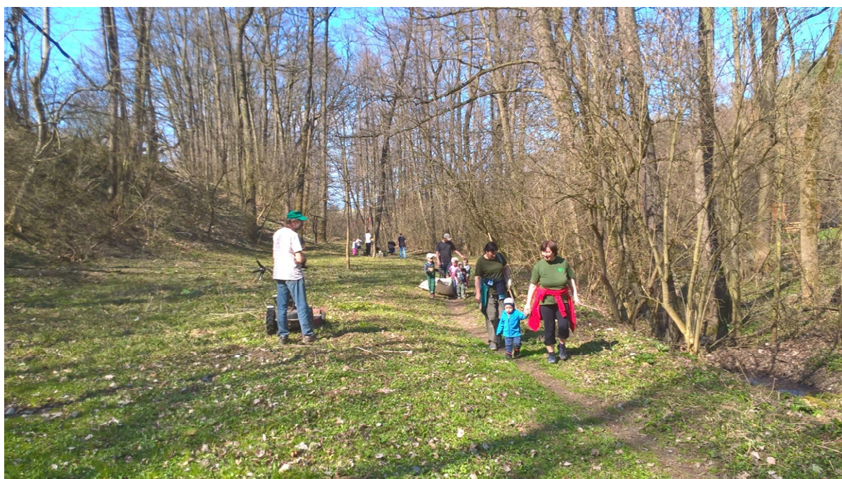
Brigáda před akcí Otevírání studánek