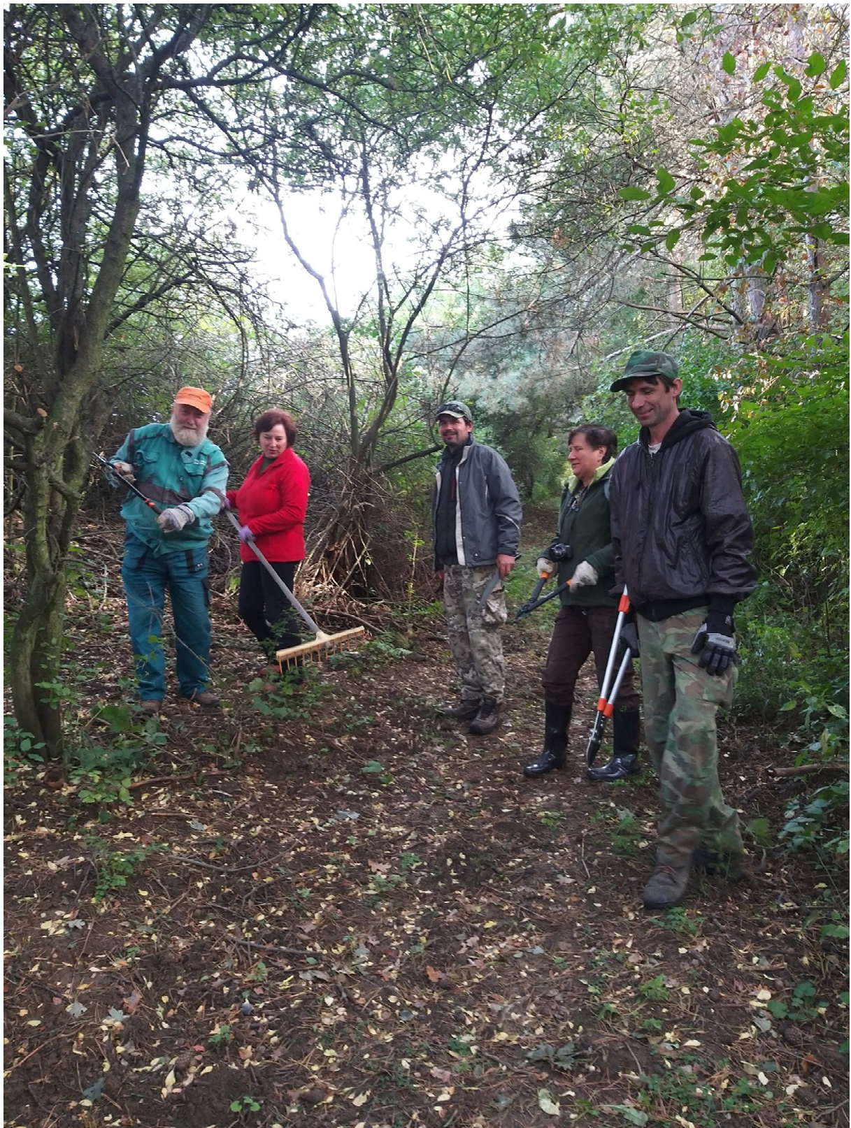
Brigáda říjen 2019