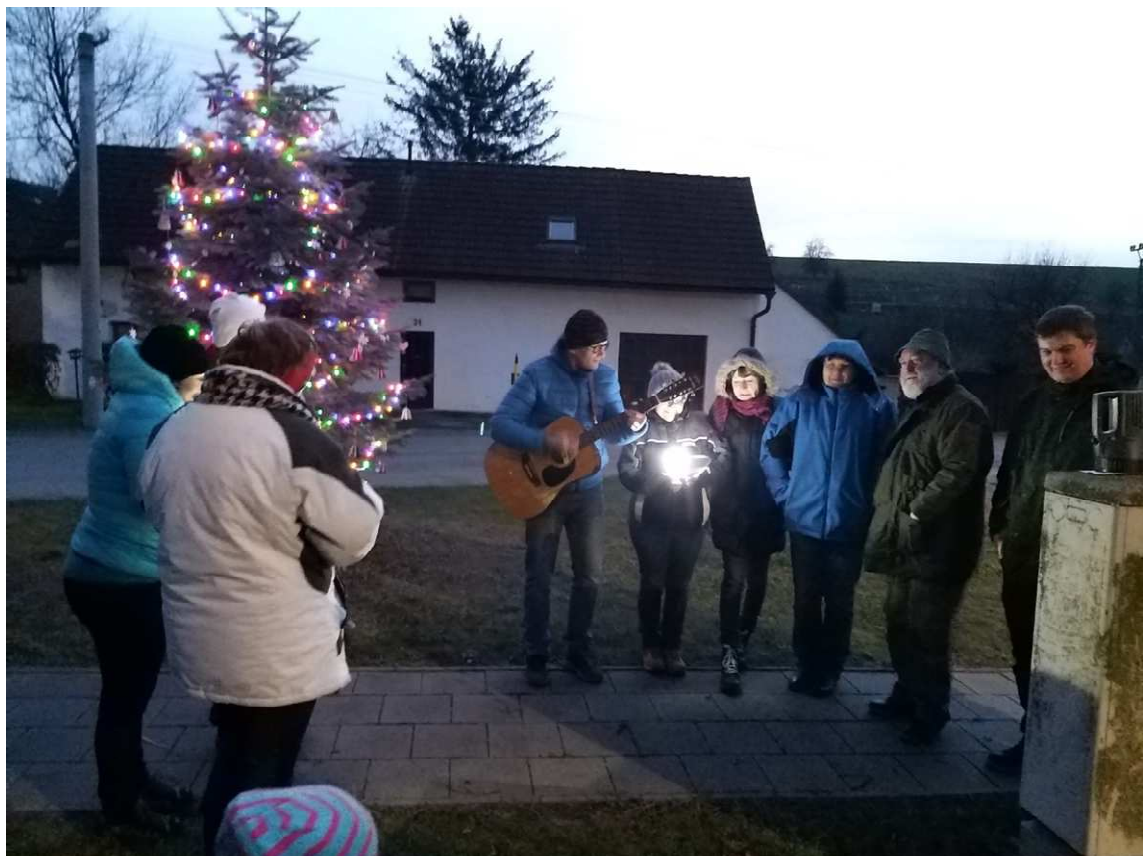
Rozsvěcení vánočního stromu