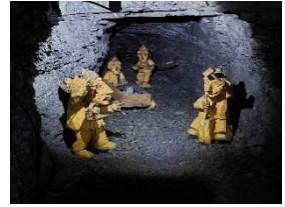
Návštěva v Klokočově