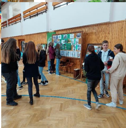
Výstava ve Zdoukách