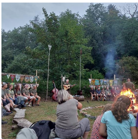
Výroční oheň trempských osad Malé Vegy a Líných koster z okolí Uherského Hradiště