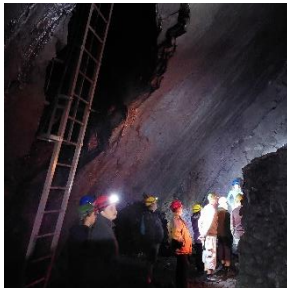
Brigáda před sjezdem rodáků