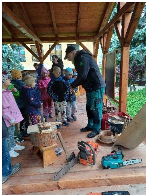
Den stromů v Mateřské škole Zdounky