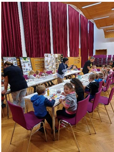
„Dny pro klíma“