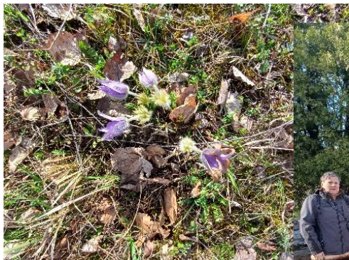
Přírodní památka „Přehon“