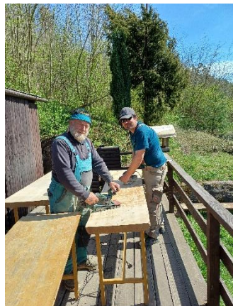
Brigáda a malé velikonoční posezení