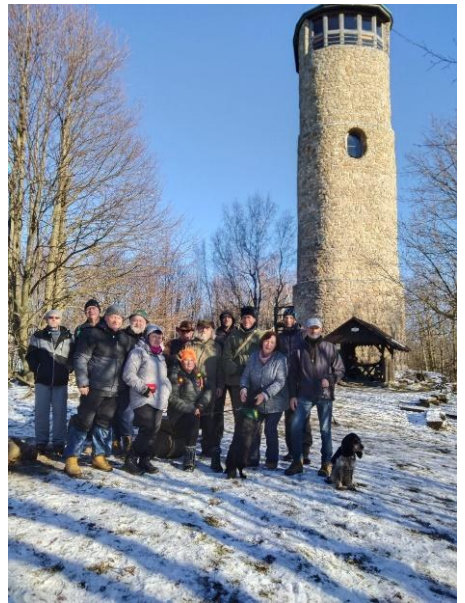
„Výstup na Brdo“