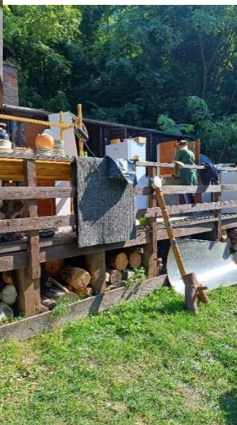
Brigáda – výměna podlahové krytiny v klubovně