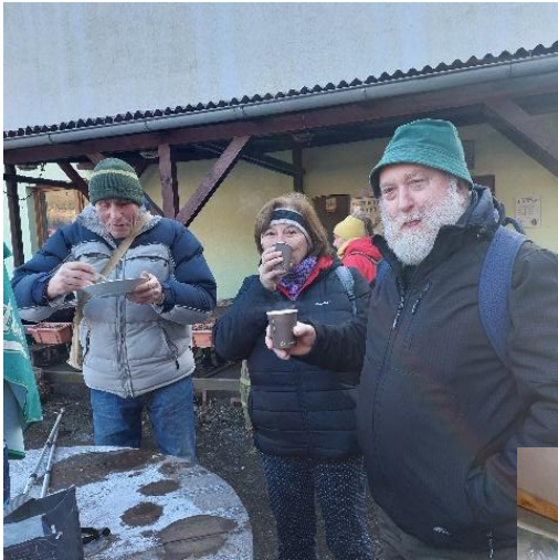
„Pochod kolem Břestocké